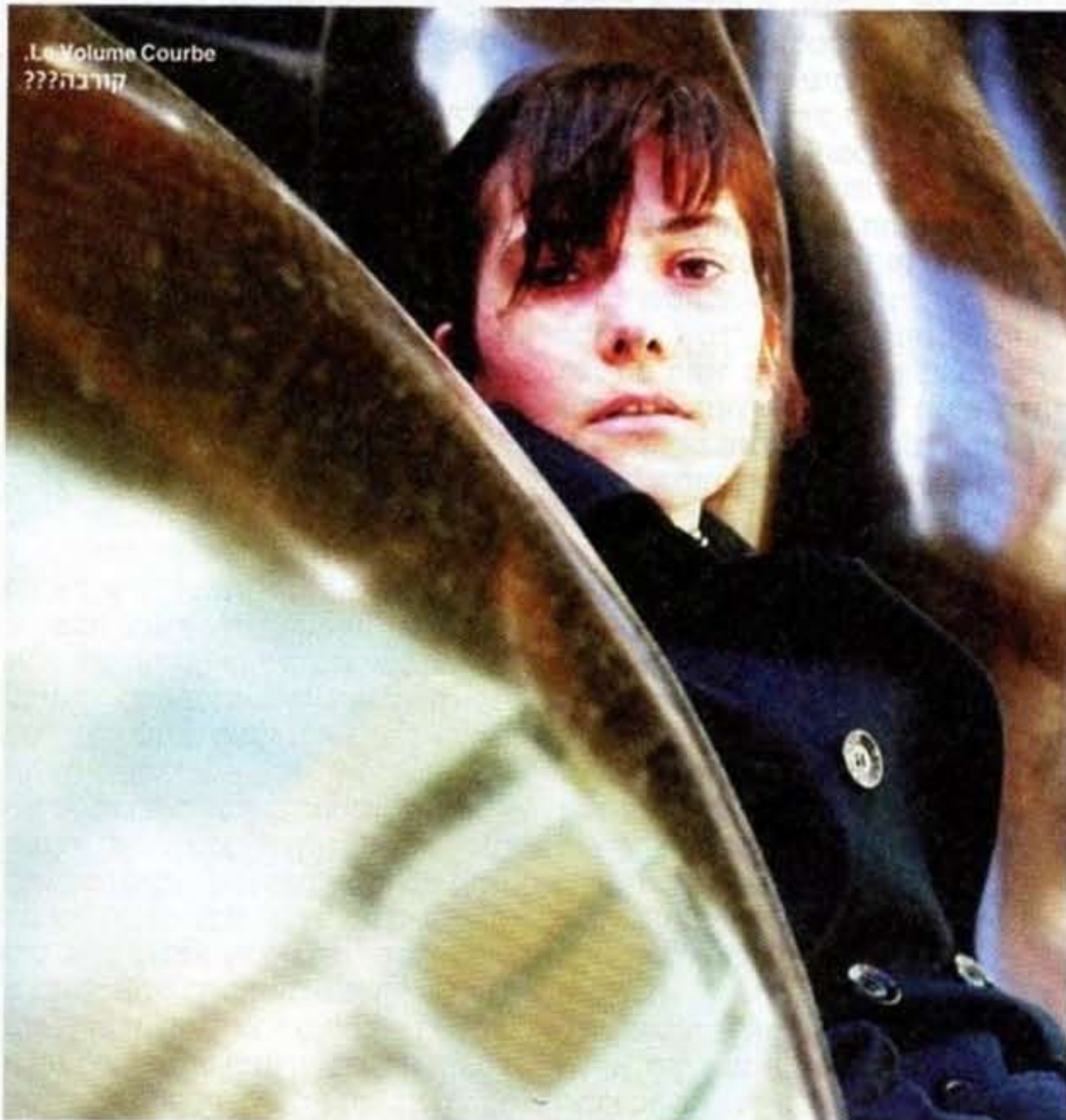
Le Volume Courbe קורבה???

היא נולדה בצרפת, חיה באנגליה, בקושי יודעת לנגן, מתמנגלת עם דיימון אלברן, נערצת על ידי הופ סנדובל, עושה רעשים מוזרים, והורגת את אמא שלה בשירים. קבלו את Le Volume Courbe, הפסיכית התורנית נדב הולנדר